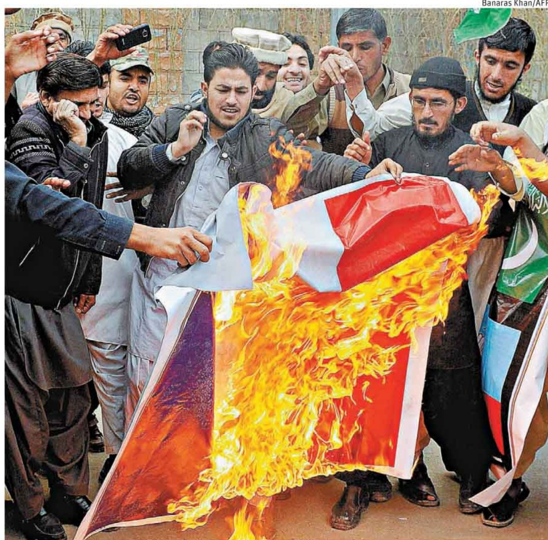
» ÓDIO Bandeira da França é queimada no Paquistão; ontem países de maioria islâmica protestaram contra a caricatura de Maomé na última edição do 'Charlie Hebdo' Mundo A8