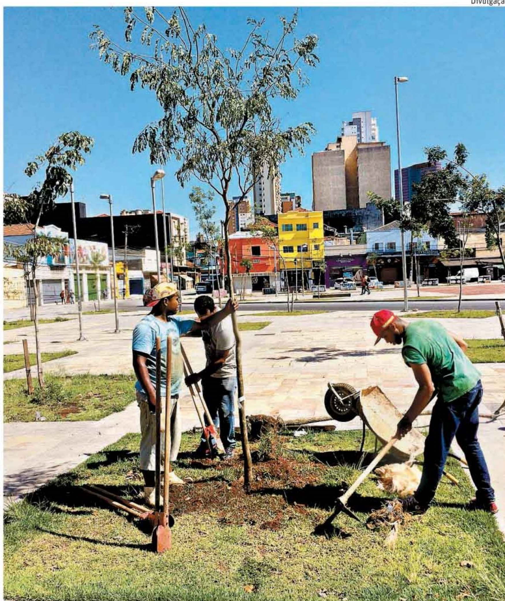
» NOVA PAISAGEM Jardineiros plantam mudas de árvores no largo da Batata, em SP; iniciativa partiu de moradores que dizem querer transformar o local num lugar menos árido Cotidiano C4

Ela está na capital Jacarta, onde o sobrinho será fuzilado neste domingo (18), no horário local. Cotidiano C1