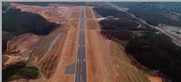
Infraestrutura. Novo aeroporto terá capacidade para receber 200 mil pousos e decolagens

As obras de pavimentação da pista (mede 2.470 metros de extensão por 45 metros de largura), construção de hangares (50 mil metros