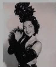
Diva: Carmen Miranda

Estão abertas as inscrições para as oficinas gratuitas oferecidas pela Prefeitura de Cotia e o MIS (Museu da Imagem e do Som). No dia 5/11 tem a oficina "Transformações da Retomada - O Cinema da Retomada aos dias de hoje" e, no dia 25/11, "De Carmen Miranda à JK: uma introdução às chanchadas". As vagas são limitadas e para participar é preciso ter idade a partir de 16 anos. Outras informações podem ser obtidas pelo número 4616-4565.