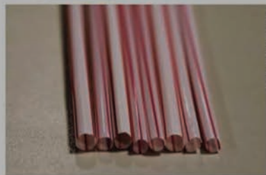
Conscientização. Multas variam de R$ 530 a R$ 5.306