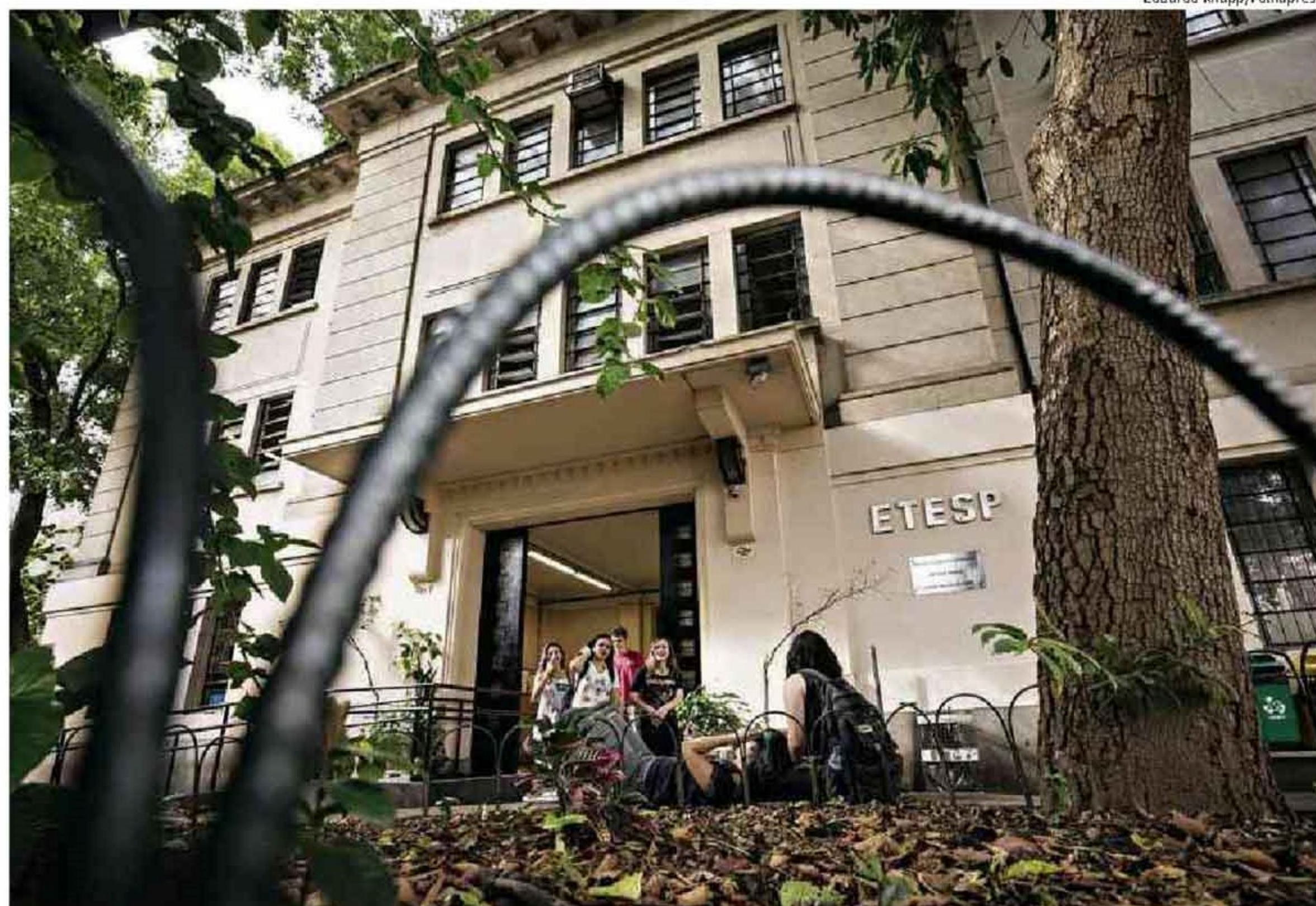
Escola Técnica São Paulo, no Bom Retiro, região central, tem o melhor desempenho entre as públicas da capital

Ao todo, nessa unidade, são 223 alunos, com duas turmas nos 1º e 2º anos do ensino médio, e uma no 3º. Ou seja: estudantes com nota ruim passam a não fazer parte no 3º ano. "Esses jovens são beneficiados porque estão den-