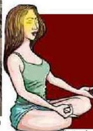
Ilustração Henrique Assale

Empresa teria criado perfis falsos para tentar influenciar eleições. A8